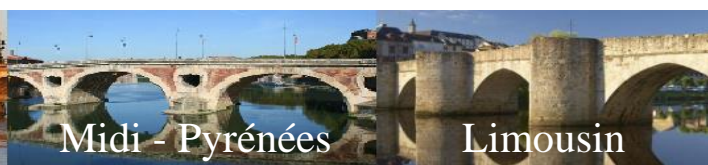
Midi - Pyrénées